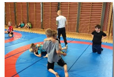
BRYDNING I IDRÆT