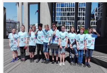
6. ÅRGANGSELEVER TIL FLL I ÅRHUS