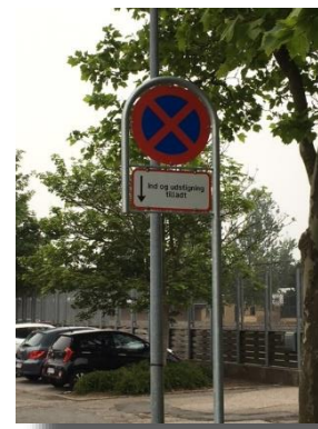
KISS'N RIDE VED GYMNASSTIKSAL