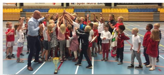
PRÆMIEOVERRÆKKELSE TIL OL