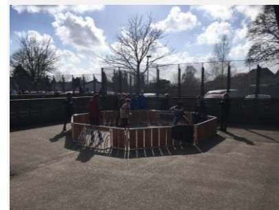
PANNABANE I SKOLEGÅRDEN

I denne uge er der blevet opsat et skilt på afsætningspladsen på vestsiden af gymnastiksalen. Området er, som tidligere udmeldt, ikke beregnet til parkering, men til afsætning – en såkaldt Kiss 'n ride-plads. Skiltet signalerer standsning forbudt, med undertavle, "Ind- og udstigning tilladt".