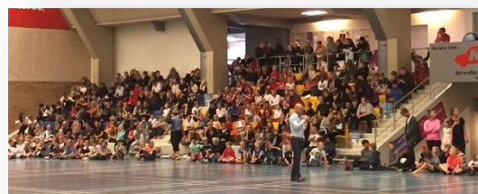
OL-AFSLUTNING I BSMC

MED VENLIG HILSEN LEDELSEN PÅ BRAMDRUP SKOLE