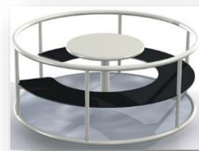
KARRUSEL TIL SPECIALCENTRET

Vi har indkøbt en del nye legeredskaber til legepladsen, ikke mindst fordi vi fra kommende skoleår modtager flere indskolingselever. Billederne af balancebanen og karrusellen giver et indblik i, hvad der etableres i sommerferien.