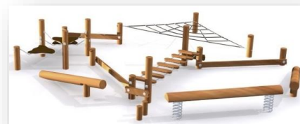
BALANCEBANE TIL SPECIALCENTRET

I løbet af sommeren vil der blive gjort klar til de nye elever både inde og ude. Bl.a. får vi på legepladsen en ny bane til motorisk udfoldelse.